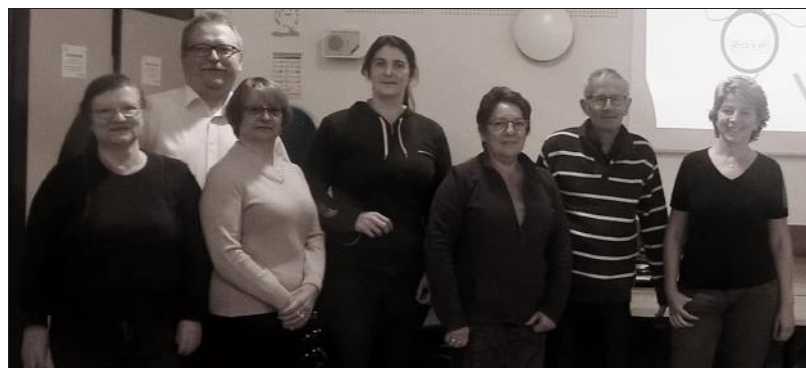
■ Le nouveau bureau se prépare à allumer les petites lumières du 8 décembre.

Classes en 8 : une nouvelle équipe à découvrir le 8 décembre