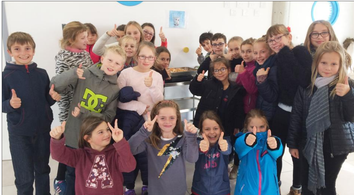
■ Les enfants sont fiers de cette réduction considérable des déchets.

Ainsi au menu du jour : velouté de potimarron local, couscous végétarien avec ses boulettes de soja et poires lo-