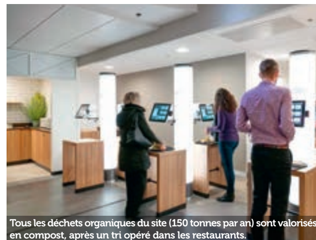
Tous les déchets organiques du site (150 tonnes par an) sont valorisés en compost, après un tri opéré dans les restaurants.

Le site d'Airbus Helicopters accueille les équipes de l'usine, de la R&D et du siège administratif d'Airbus Helicopters. Trois restaurants leur suggèrent 4 univers de restauration avec une offre naturalité et bien-être, mettant l'accent sur une cuisine légère et végétale à base de produits riches en vitamines et minéraux, une offre thématique autour de recettes du monde, une offre traditionnelle avec des plats mijotés, des bocaux et des classiques de la gastronomie régionale et