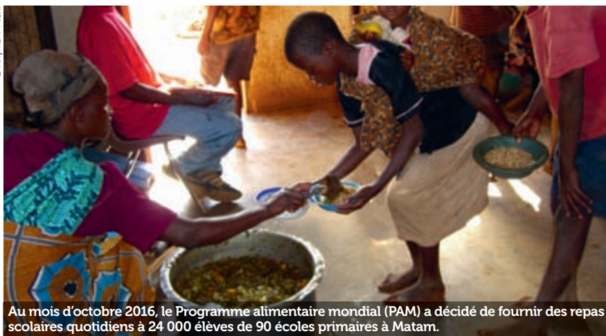
Au mois d'octobre 2016, le Programme alimentaire mondial (PAM) a décidé de fournir des repas scolaires quotidiens à 24 000 élèves de 90 écoles primaires à Matam.